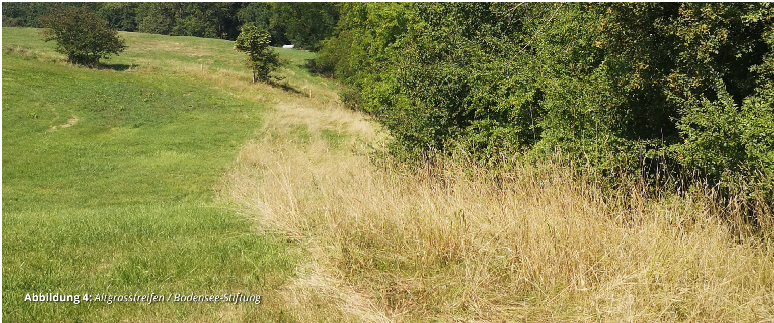
Abbildung 4: Altgrasstreifen / Bodensee-Stiftung